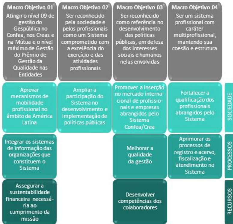
Figura 2. Mapa Estratégico do Plano Institucional do Confea (PIC) 2021-2023